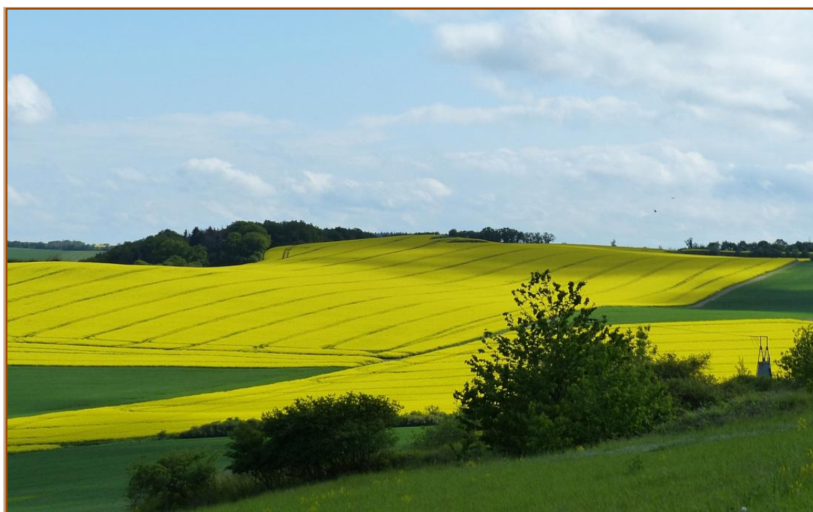
Impressionen von Plaidt (Mai 2013)